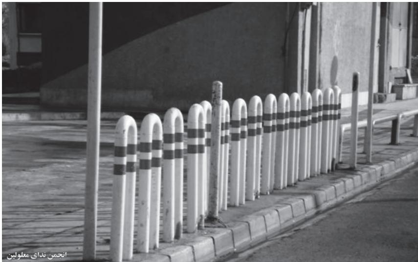
انجمن ندای معلولین

برگزاری جشن‌هایی با عنوان معرفی جوانان معلول توانمند به جامعه، اصلی‌ترین آرزو و خواست همگانی است. هاشمی با اشاره به تعداد زیادی از معلولان که در این دوره از جشنواره حضرت علی اکبر(ع) در بخش جوان دارای توانایی خاص شرکت کرده بودند، بیان کرد: پس از بررسی دقیق آثار جوانان معلول و با توجه به این که ۱۶